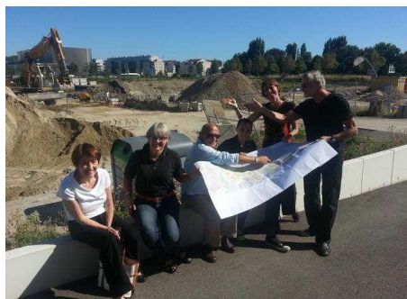
Sur le site de l'éco-quartier Danube