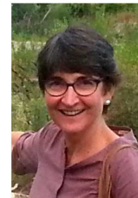
Le conseil d'administration des Amis de L'Arche en Alsace